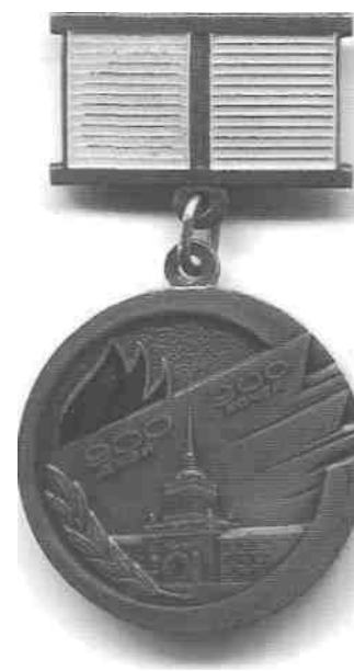
Знак «Жителю блокадного Ленинграда»