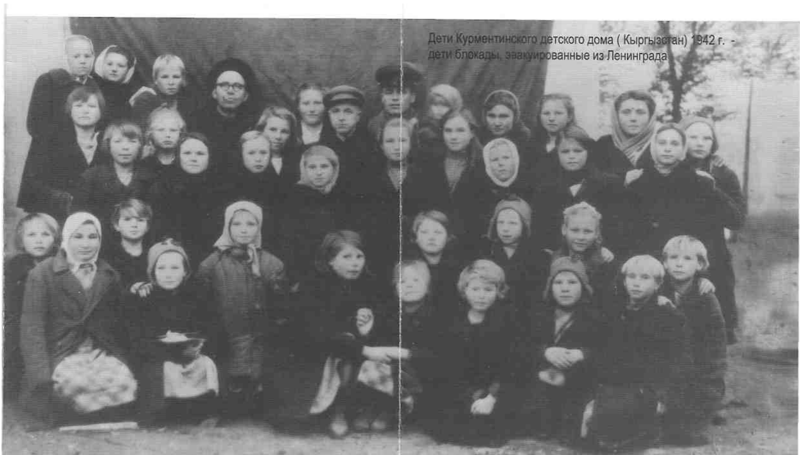
Дети Курментинского детского дома ( Кыргызстан) 1942 г. - дети блокады, эвакуированные из Ленинграда